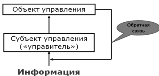
Рисунок 8 – Наименование рисунка выравнивается по центру, печатается нежирным шрифтом размером 14 пунктов и при необходимости оно может быть продолжено на следующей строке

После подрисуночной подписи оставляется одна пустая строка и продолжается печать текста.